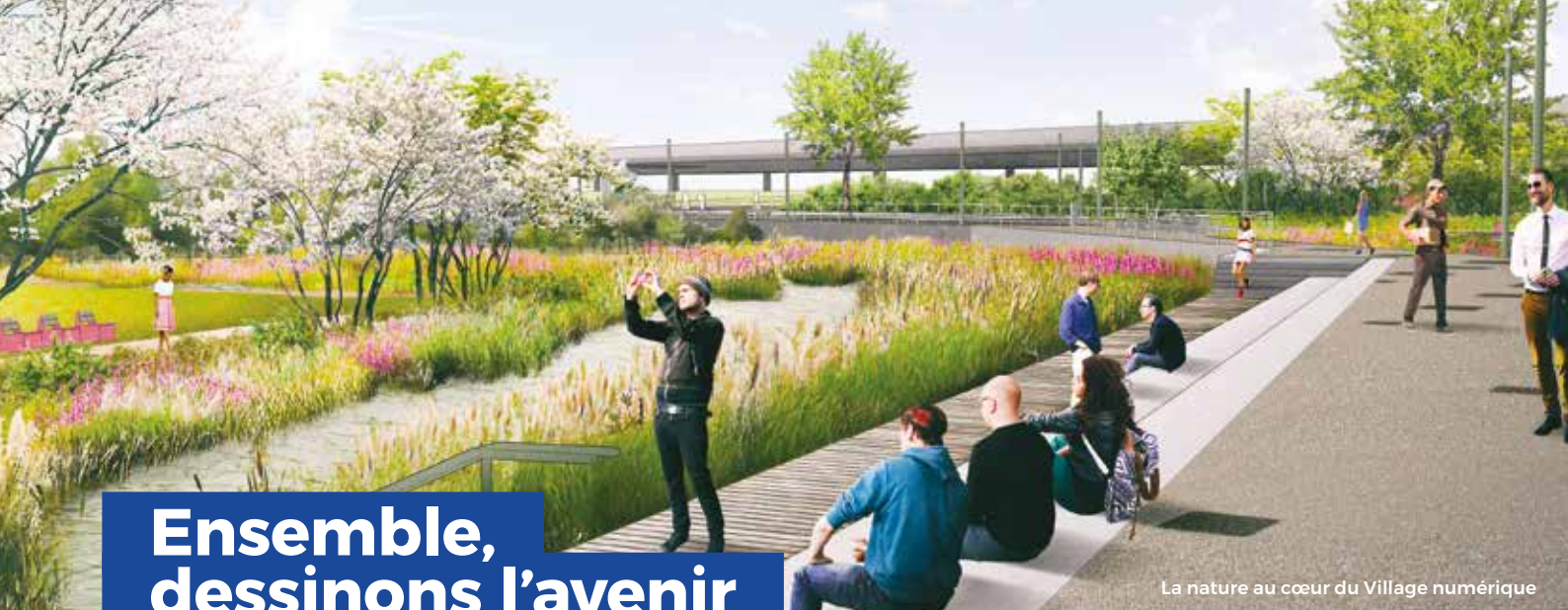
La nature au cœur du Village numérique